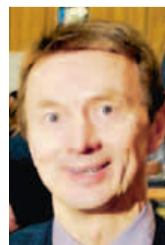
Hans Kristian Amundsen.